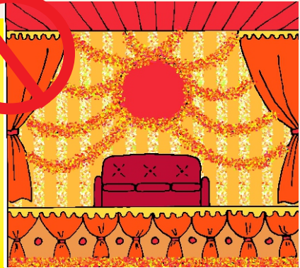
डेकोरेशन में सचित फूलों का उपयोग न हो

परिग्रह वृत्ति एवम् परिग्रह संग्रहण के संबंध में भी ऐसे सामाजिक प्रयास अच्छे परिणाम दिखा सकते हैं जो व्यक्ति की सत्ता या संपत्ति की लिप्साओं पर सामूहिक प्रतिबंध लगाते हो। (आत्म-समीक्षण)