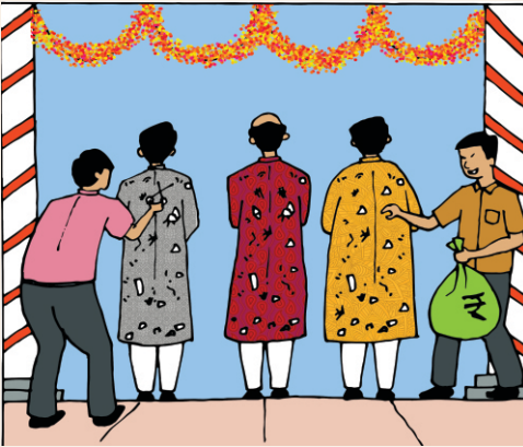
आयोजनों के पीछे की वास्तविकता (इवेंट वाले, केटरर्स, डेकोरेटर्स चीथड़े उड़ा रहे हैं)

बहुत से सम्पन्न व्यक्ति इस तरह तर्क करते हैं कि आज हमारे पास किसी चीज की कमी नहीं है, एकाएक बेटे/बेटी है हमारा, अब उसकी शादी में हम अपना शौख पूरा न करें तो क्यों? बस इसी सोच ने, इसी तर्क ने समाज को कहाँ से कहाँ पहुँचा दिया है। लोग स्वच्छंद हो गए, कोई बोलने वाला नहीं, कोई टोकने वाला नहीं, हम करें सो कायदा। एक ऐसी स्कूल देखने में आई है जहाँ सभी बच्चों को सूती कपड़े की ड्रेस पहनना होता था और स्कूल में सिर्फ साईकल या पैदल ही आ सकते हैं। ताकि बच्चों में किसी तरह की ऊँच-नीच, अमीर-गरीब की भावना न आए। जब तक समाज में छोटे-बड़े का भेद बढ़ता रहेगा वहाँ समभाव आ ही नहीं सकता। परिणामस्वरूप उस समाज में नए-नए जुर्म होंगे, युवा पीढ़ी अपराधी बनेगी और कारण होगा हमारी वही जिद कि हम कर रहे हैं तो आपको क्या तकलीफ? इसी दिखावे की होड में हमारी छवि एक शोषक वर्ग की बन गई है। याद करें ओडिशा में कुछ वर्ष पहले ऐसे हालात बन गए थे कि सभी शादियां बंद हाल में होती थी। क्या हम उन परिस्थितियों को आमंत्रित कर रहे हैं।