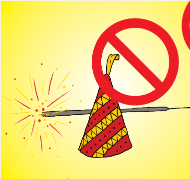
आतिशबाजी न हो